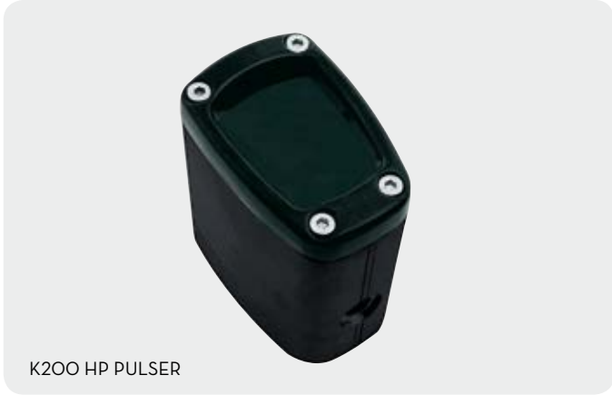
K200 HP PULSER