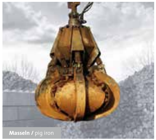
Masseln / pig iron