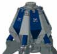
B geschraubte Rammschutzhauben screwed protection hoods