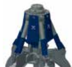
C geschraubte Schutzbleche screwed protection plates