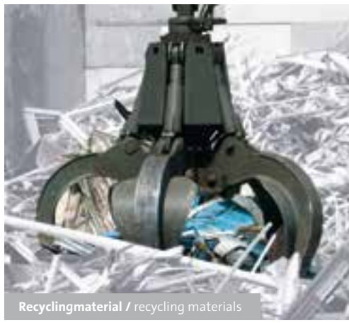
Recyclingmaterial / recycling materials