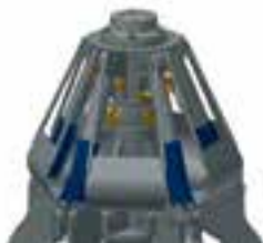
A geschweißter Rammschutzkäfig welded protection basket