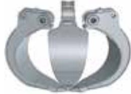
B halboffene Schalenausführung semi-open shell design