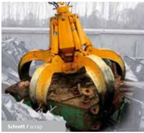
Schrott / scrap