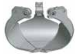
C geschlossene Schalenausführung closed shell design