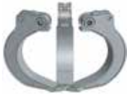
A offene Schalenausführung open shell design