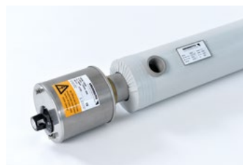
Rohrisolierung aus PU-Schaum

Alle Preise zzgl. gesetzl. MwSt., Preise gültig bis 31.12.2022