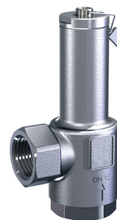
SP 85 DN 10 - DN 50