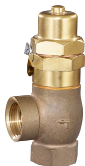
SP 80 DN 10 - DN 50