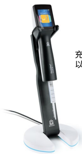
充电支架与HandyStep® touch S 以及PD-Tip //