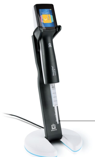
充电支架与 HandyStep® touch S 以及 PD-Tip //